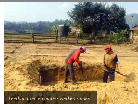
Leerkrachten en ouders werken samen

In bovenstaande foto zien we de moeders aan het werk. Een extra motivatie is dat ze ook een deel van de jonge plantjes naar huis