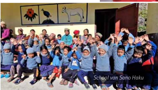
School van Sano Haku