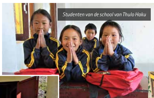
Studenten van de school van Thulo Haku