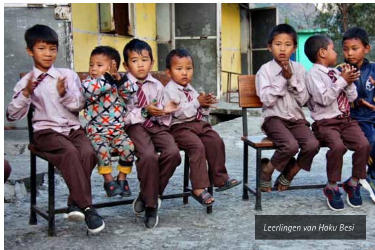
Leerlingen van Haku Besi