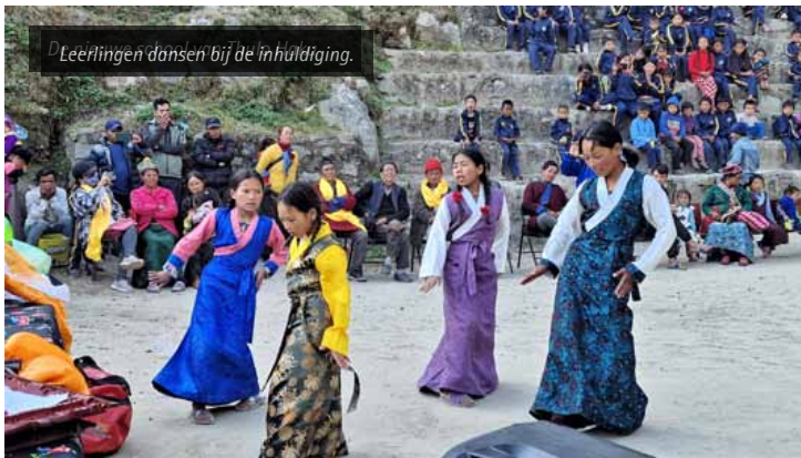
Leerlingen dansen bij de inhuldiging.