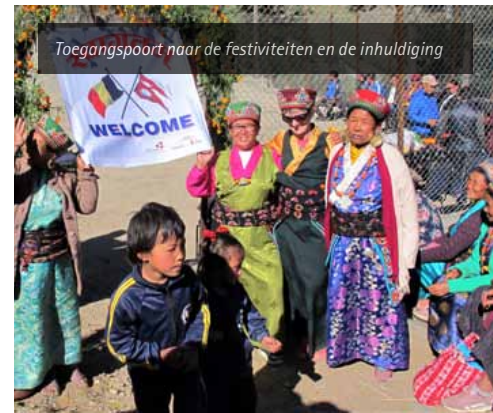
Toegangspoort naar de festiviteiten en de inhuldiging