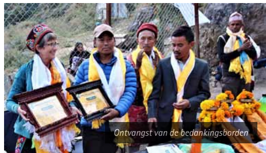
Ontvangst van de bedankingsborden