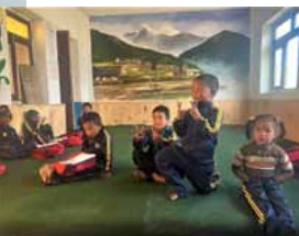
Klaslokalen in Thulo Haku