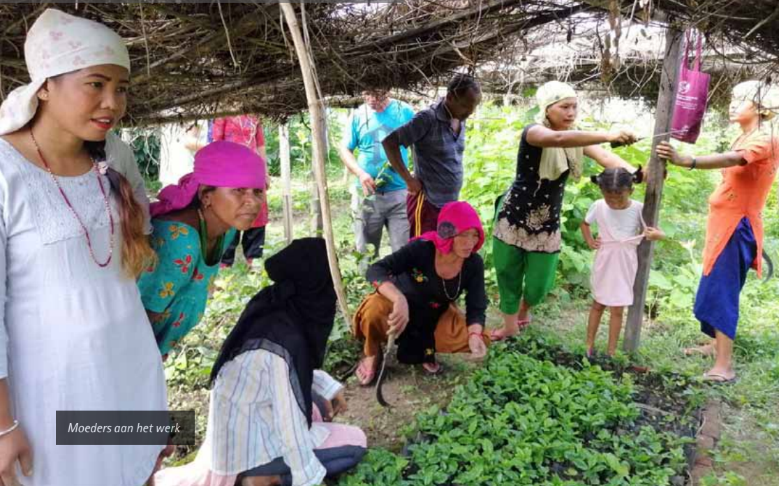
Moeders aan het werk